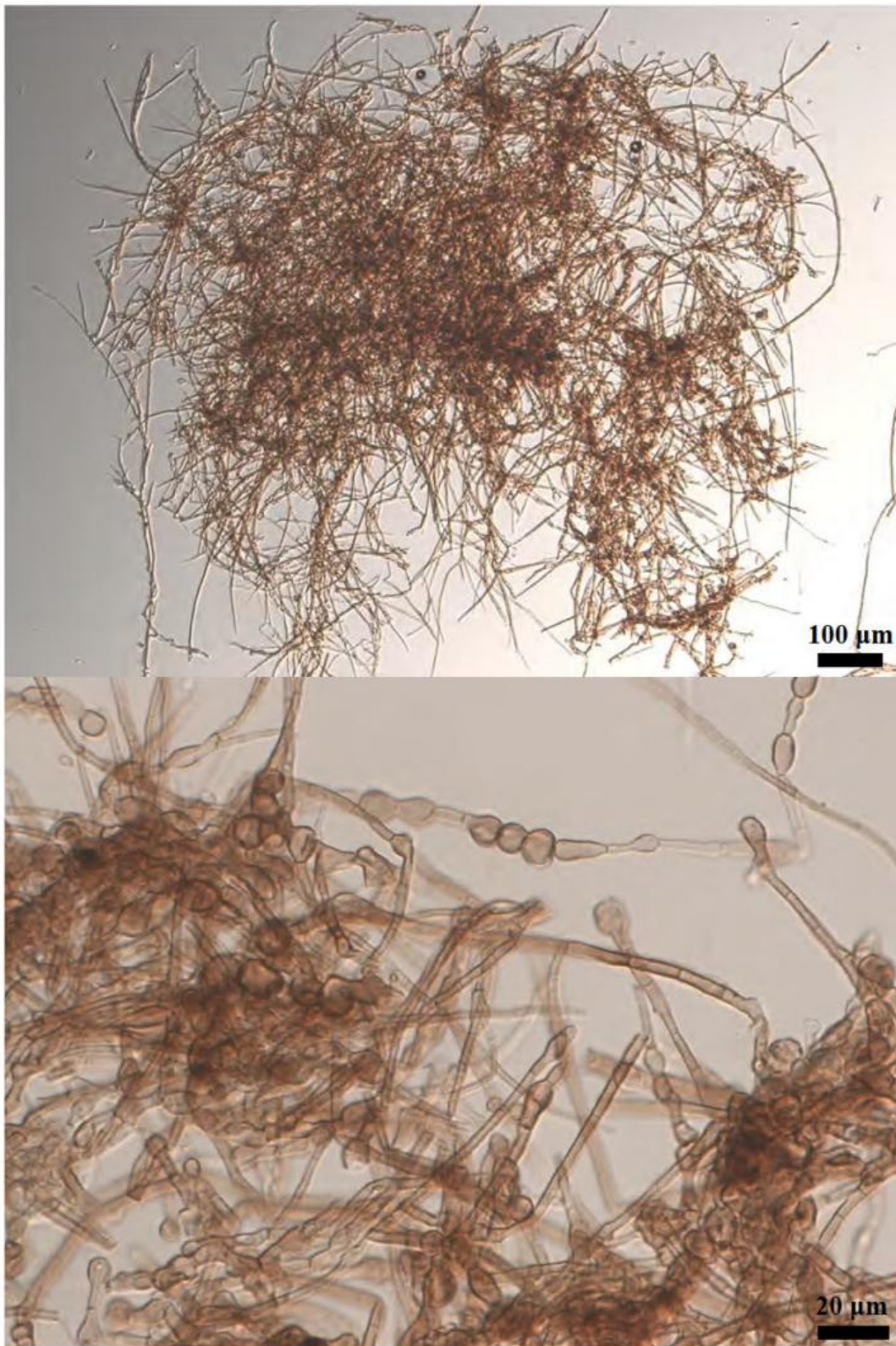
図 2. SIID00000 の光学顕微鏡観察像 (微分干渉観察像)